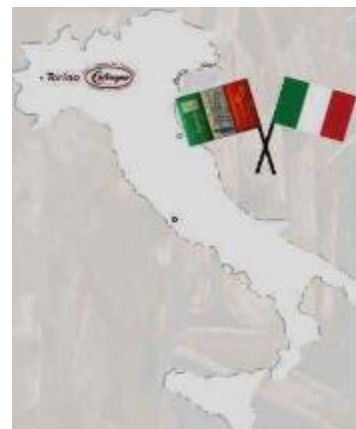
Aldo Frezzato & Franco Rossini, les artisans chocolatiers de la Premier Cioccolato Calcagno de Turin (photo : Septembre 2010)